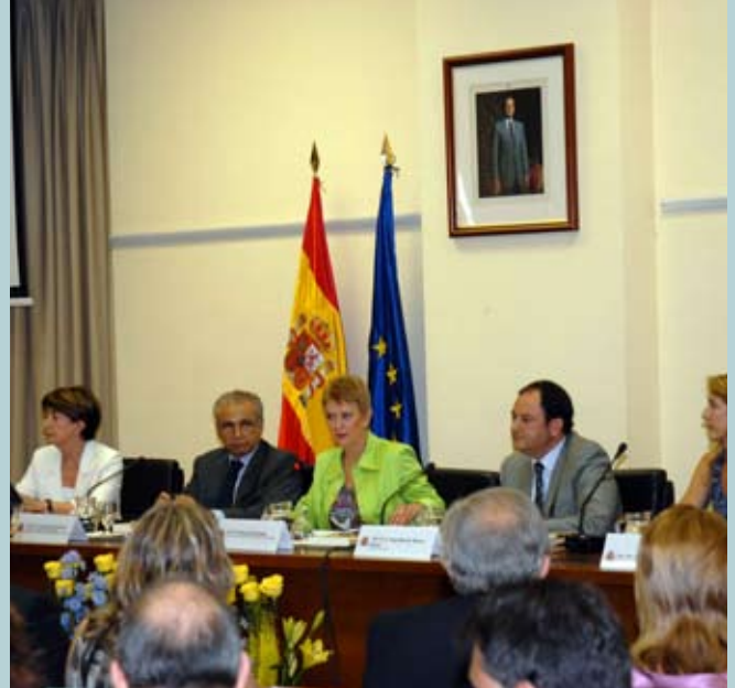
Momentos de la presentación del número monográfico, con la presencia de los miembros de su Consejo de redacción y de la Secretaria de Estado para la Función Pública, Consuelo Rumí

Para firmar los artículos se han buscado nombres que podían aportar un conocimiento profundo de la Administración General del Estado, además de experiencia y “memoria institucional”. A todos ellos, la propia Marchena agradeció que no sólo hubieran hecho un análisis interno de las debilidades del sistema, sino que estudiaran sus posibilidades de solución e incluso, hayan ofrecido líneas estratégicas de mejora, al estilo de una “hoja de ruta” moderna.