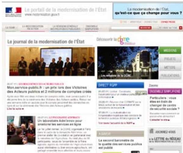
Portal de Modernización del Estado. www.modernisation.gouv.fr/