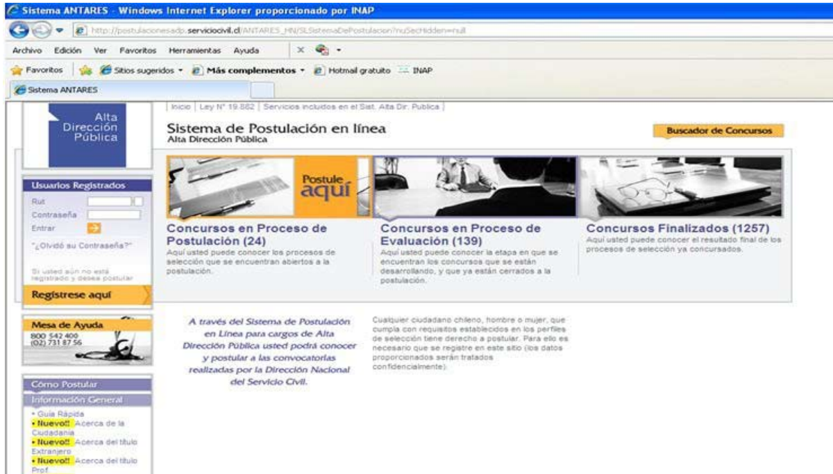
Imagen del Sistema Antares – Sistema de Postulación en línea

Existe la figura del alto directivo público “provisional y transitorio”, nombrado mientras se realiza el proceso de selección del cargo correspondiente. Según se determina en las últimas instrucciones dictadas por el propio Presidente de la República de Chile, Sebastián Piñera Echenique, la vigencia de estos nombramientos no debe exceder de seis meses. Asimismo en el marco de estas mismas instrucciones, merecen destacarse, entre las particularidades de estos puestos de altos directivos ocupados de forma transitoria y provisional, que dicha condición debe ser invocada en sus actuaciones de carácter público y que no debe ser considerada como mérito en los concursos que se convoquen. De este modo, se garantiza el acceso en igualdad de condiciones de todos los candidatos.