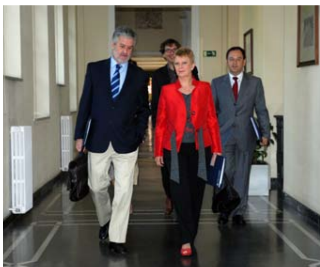
Público asistente y momento de la llegada de Manuel Marín

“Europa terminará avanzando, a pesar de sus deficiencias y sus movimientos de ida y vuelta. No es posible volver a la autarquía en la Era de Internet. Sólo hay que poner límite a los excesos y tener un modelo que sirva a los intereses de la mayoría, fundado en el empleo y la gobernanza”, indicó.