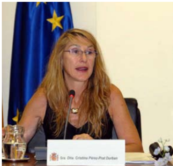
Cristina Pérez-Prat Durban durante su ponencia

INTEGRACIÓN Y EMPLEO PÚBLICO. La directora general de Función Pública, Cristina Pérez-Prat Durbán, resaltó que, en materia de empleo público, España es un referente para los países europeos en cuanto a cómo organizamos la adopción de acuerdos internos y cómo se resuelve las cuestiones de movilidad de los funcionarios, puesto que esta figura no suele estar reconocida en la mayoría de los países.