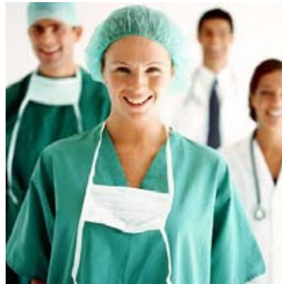
Imagen de dominio público

“El proceso legislativo de reforma está en marcha y el EBEP admite que será largo y complejo (...), pero que es necesario articular la gestión del empleo público en España a las necesidades del siglo XXI”