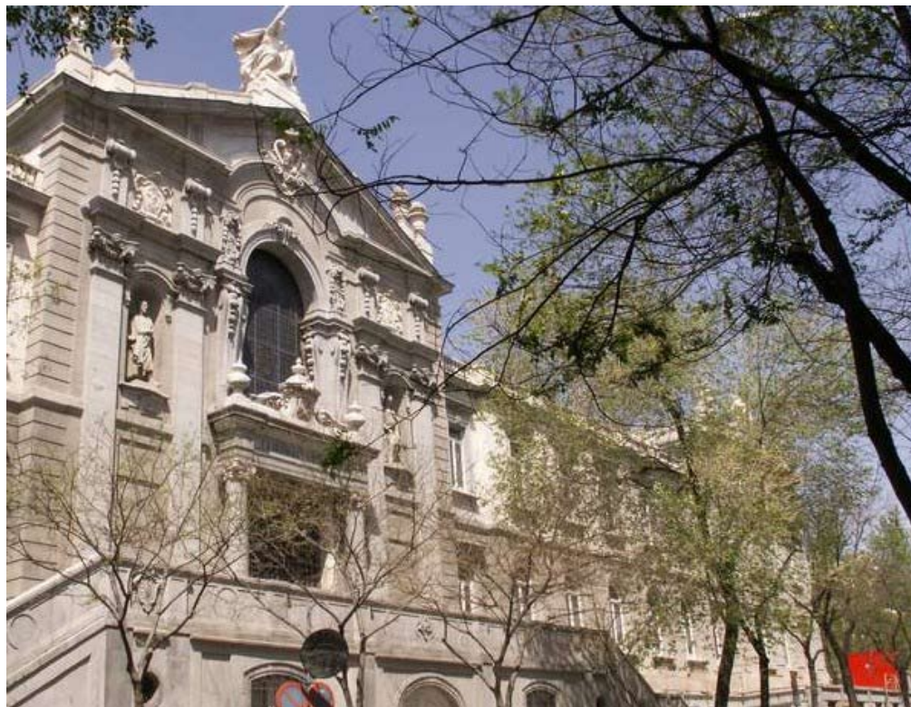
Fachada del TS a la calle de Bárbara de Braganza.

La segunda cuestión de trascendencia que plantea el Tribunal es la relativa a las condiciones o circunstancias en las que resulta aplicable el precepto, aspecto que también está relativamente claro en la regulación legal. A estos efectos, la