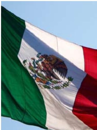
Bandera de los Estados Unidos Mexicanos

Guarda la idea del empleo público una fuerte vinculación con la de la función pública (al grado de llegar a considerarse sinónimos en algunos casos), actividad reservada a los órganos depositarios del poder público, explicable como la actividad esencial del Estado contemporáneo, fundada en la idea de soberanía, cuya realización satisface necesidades