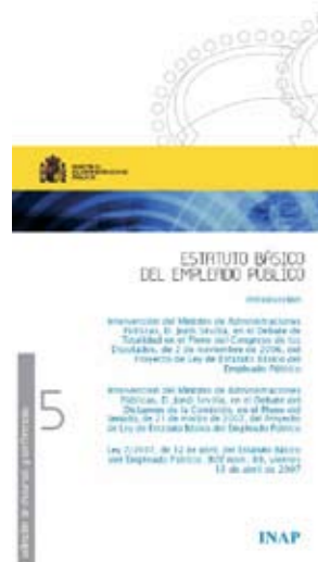
Portada de la monografía que el INAP editó en 2007 con motivo de la aprobación del EBEP

laboralización, tampoco parecía conveniente funcionarizar a todo el empleo público, luego debería acercarse el grueso de la regulación 3 . — Que el Estatuto fuera de mínimos: para que sea aplicable a todo el sector público, que tenga claramente delimitado lo que puede y lo que no puede hacerse. No muchas reglas, pero sí claras, sencillas y firmes. — Que no fuese un texto refundido encubierto, pues eso dejaría todo el sistema exactamente igual 4 . Y todo ello porque las razones fundamentales que justifica-