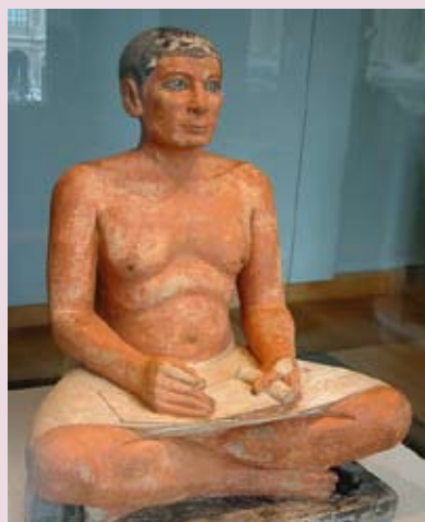
El escriba sentado (Museo del Louvre, París).

El fenómeno burocrático, desde los inicios del Estado, va de la mano de la administración pública; así, en el antiguo Imperio egipcio (3200-2270 a. C.) existió una amplia estructura administrativa que, encabezada por el gran visir o primer ministro, estaba organizada jerárquicamente, con divisiones departamentales por materias, a las órdenes del faraón. Los funcionarios eran formados en escuelas especiales que funcionaban a nivel central y provincial, en las cuales se les enseñaba educación general y práctica administrativa. Los servidores públicos eran pagados directamente por el Estado, gozaban de inamovilidad, y en algunos casos los cargos eran hereditarios.