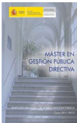
ARRIBA: Momento de la inauguración del Máster. DEBAJO: Asistentes a la jornada. AL LADO, el folleto informativo del programa, que puede descargarse pulsando en la imagen.