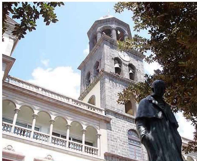
Edificio del Tribunal Superior de Justicia de Canarias (estatua dedicada a José Murphy).

En tercer lugar, además se debe tener en cuenta que, en