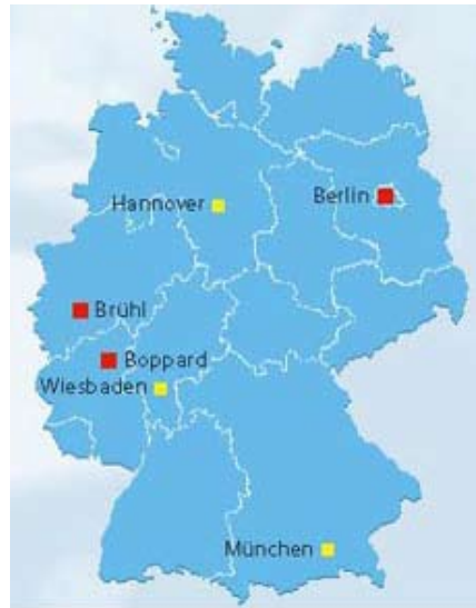
Diferentes sedes de la BAKÖV.

Su misión fundamental es la de proporcionar formación superior a los empleados de la administración federal. La Aca-