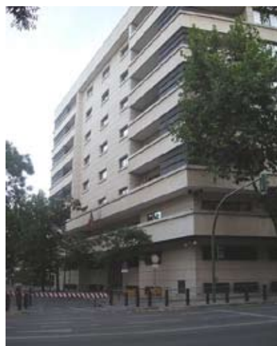
Sede de la AN (calle de García Gutiérrez).

to que vinieran desempeñando o en otros puestos vacantes dotados presupuestariamente existentes en el municipio, siempre que sean de necesaria cobertura y se cumplan los requisitos establecidos en la relación de puestos de trabajo. En este caso, quedarán excluidos del sistema de adjudicación de destinos por el orden de puntuación obtenido en el proceso selectivo. Las convocatorias podrán excluir la posibilidad prevista en el párrafo anterior” . Asimismo, y como señalábamos anteriormente, la disposición transitoria segunda de la Ley