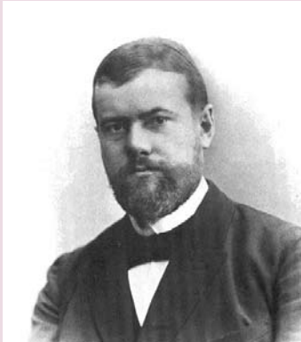
Retrato de Max Weber (hacia 1894).

Posteriormente Max Weber vendría a revolucionar la teoría de la burocracia, a la que definió como “un sistema para el desarrollo de los asuntos de gobierno por medio de ministerios y órganos, dirigidos por un titular capaz de dar particular énfasis a la práctica y al procedimiento de carácter conservativo” 3 .