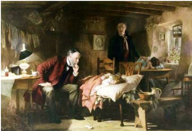
'El doctor', pintura de Samuel Luke Fildes. Imagen de dominio público

La Ley 14/1986, de 25 de abril, General de Sanidad preveía la aprobación de un Estatuto Marco como norma especial que supondría la superación del marco legal pre-constitucional, previsión reiterada en la Ley 30/1999, de 5