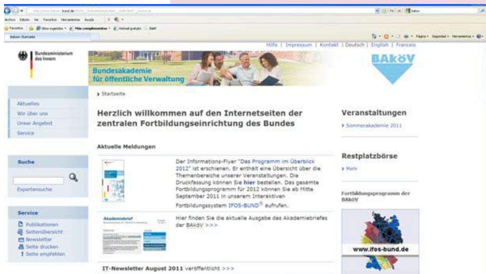
Sitio web de la BAKöV

Al dedicarse únicamente a la formación, la plantilla de la BAKöV no es muy amplia: nuestro personal lo componen 50 funcionarios repartidos entre las tres sedes. La BAKöV está estructurada en seis Divisiones (Training Divisions): cinco de ellas se encuentran en Brühl y una en Berlín.