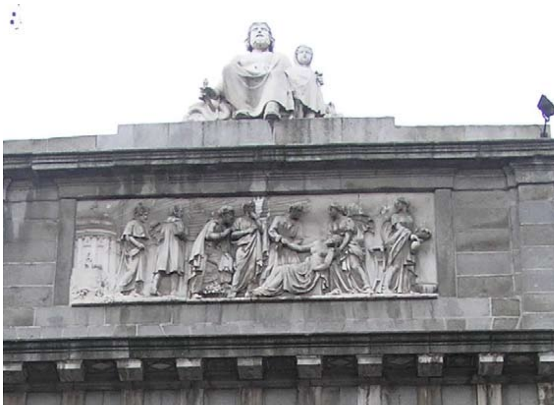
Escultura de Esculapio que preside la fachada del INAP

de las retribuciones complementarias previstas en el artículo 24 del presente Estatuto.