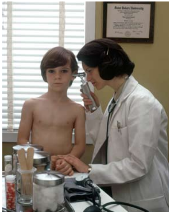
Una doctora examina a un niño. Imagen de dominio público

3. Los funcionarios de carrera que obtengan destino en otra Administración Pública a través de los procedimientos de movilidad quedarán respecto de su Administración de origen en la situación administrativa de servicio en otras Administraciones Públicas. En los supuestos de cese o supresión del puesto de trabajo, permanecerán en la Administración de destino, que deberá asignarles un puesto de trabajo conforme a los sistemas de carrera y provisión de puestos vigentes en dicha Administración».