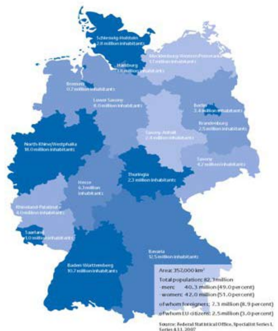
Mapa de la República Federal de Alemania.

Las actividades de BAKöV se dirigen a funcionarios federales de todos los niveles: tanto a quienes realizan tareas auxiliares como a puestos de nivel pre-directivo o directivo