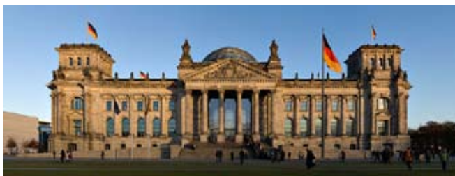
Edificio del Reichstag en Berlín. Autor: Jürgen Matern

La República Federal de Alemania está formada por estados (Länder), con responsabilidades y derechos soberanos que no son transferidos o delegados desde la Federación (Bund) que los une, sino que son garantizados por la Ley Fundamental (Grundgesetz). El poder del Estado se divide entre la Federación y los Länder según sus funciones y cometidos.