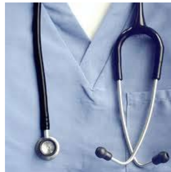
Imagen de dominio público

“Para dar respuesta a esta realidad [del Estado autonómico] se reduce la densidad de la legislación básica y se afronta la relevante multiplicación de las formas de gestión de las actividades públicas, dentro de cada nivel territorial de gobierno”