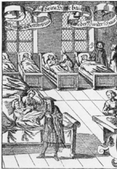
Un médico visitando a los enfermos en un hospital. Grabado alemán de 1682. Imagen de dominio público

“A pesar de la aparente sencillez y claridad de las consideraciones expuestas, son muchas las cuestiones que quedan por resolver”