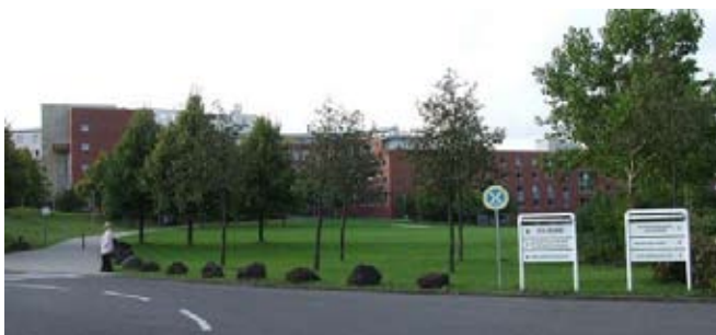
Edificio de la BAKÖV en Brühl.

La BAKÖV (Die Bundesakademie für öffentliche Verwaltung), la Academia Federal de Administración Pública de la República Federal Alemana