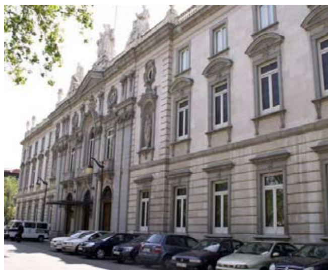
Sede del TS (plaza de la Villa de París). Fotografía de J.L. de Diego

“El pronunciamiento, equivocadamente, legítima y mantiene (...) una solución que se había considerado ilegítima en la sentencia recurrida”