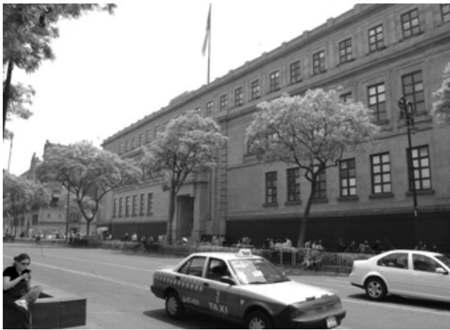
Fachada de la Suprema Corte de Justicia de la Nación de México.

Conocida también como “Ley del trabajo burocrático”, el ordenamiento legal en cita tampoco hace alusión a contrato laboral alguno, y, en cambio, en su artículo 1º y en los que